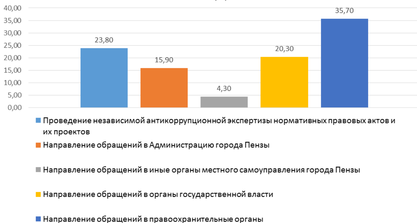
Наиболее эффективные антикоррупционные меры по мнению респондентов (%)

Считают эффективными меры, предпринимаемые в городе Пенза по борьбе с коррупцией – 49,7%, что составляет наибольшую часть. Однако, важным является количество людей, считающих проводимые меры незаметными, что составило 36,8%. Очевидно противоречие, ведь подавляющее большинство ответило, что СМИ регулярно информируют его об антикоррупционных мероприятиях. Тем не менее, этот показатель позволяет сделать определенный вывод касательно увеличения интенсивности информированности населения о работе компетентных органов в сфере борьбы с коррупцией. Самой эффективной мерой в этой сфере по мнению респондентов является направление обращений в правоохранительные органы – 35,7%.